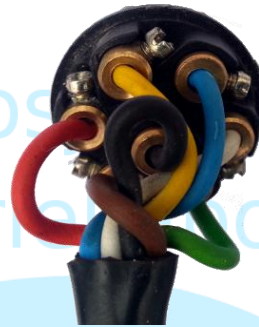
Priekabos sujungimo su automobiliu kištukas iš vidaus