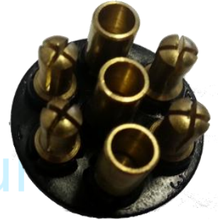
Priekabos sujungimo su automobiliu kištukas iš išorės