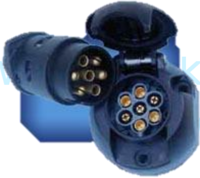
Priekabos sujungimo su automobiliu 7- nių kontaktų kištukas ir rozetė